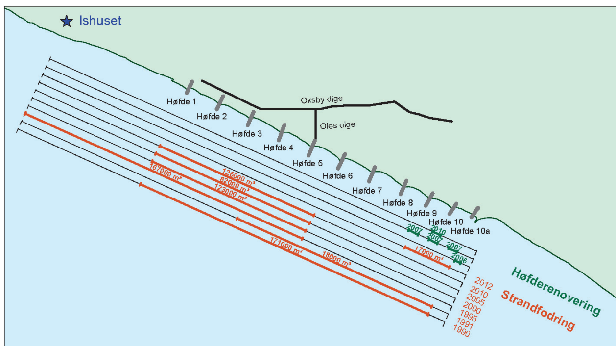
Figur 2 Kystbeskyttelsesindsats siden 1990

Den hidtidige kystbeskyttelsesindsats siden 1990 ses på figur 2.